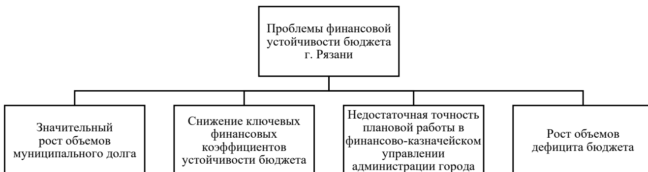
Рис. 2. Факторы ухудшения финансовой устойчивости городского бюджета Рязани в 2023 г.

Объем общественных дел, вверенных органам местного самоуправления города Рязань, постоянно увеличивается. Однако муниципальное финансирование не всегда отвечает возникающим потребностям. Большая часть муниципальных доходов перераспределяется через межбюджетные трансферты, использование которых является целевым и город Рязань не может свободно использовать эти средства. По этой причине перед городом стоит непростая задача – определить наиболее важные приоритеты и рационально и эффективно распределить средства, поэтому постоянный анализ финансовых ресурсов очень важен, поскольку он показывает,